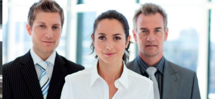
Für die Unternehmerinnen und Unternehmer