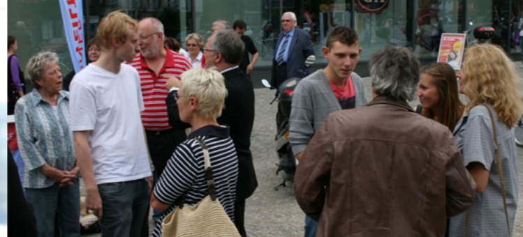
Für die Berlinerinnen und Berliner