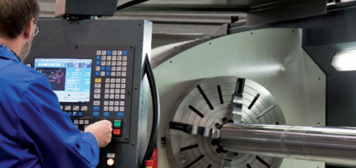
Für die Industrie