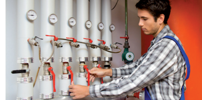
Für das Handwerk

Liebe Berlinerinnen und Berliner, die SPD-Fraktion macht verantwortliche Politik für Berlin: Wir arbeiten für mehr Wirtschaftskraft und mehr Arbeitsplätze. Durch den großen Einsatz von allen stehen die Zeichen in der Stadt weiter auf Wachstum. Berlin ist eine wettbewerbsfähige Industriestadt und auf dem Weg zu einer Spitzenregion in Deutschland. Beim Wirtschaftswachstum belegen wir bereits den Spitzenplatz.